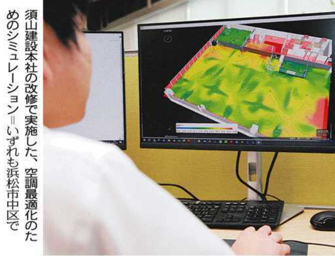
実施した職場の気流や温度変化のシミュレーションだ。空調性能を従来比で54%引き下げて電力消費を抑えつつ、外気の影響を減らすことで職場の快適さを保てることを確認した。

パソコンに表示された図面に青や黄、赤色が変わっていき、須山建設(同市中)が、2022年に本社をZEBに改修した際に実